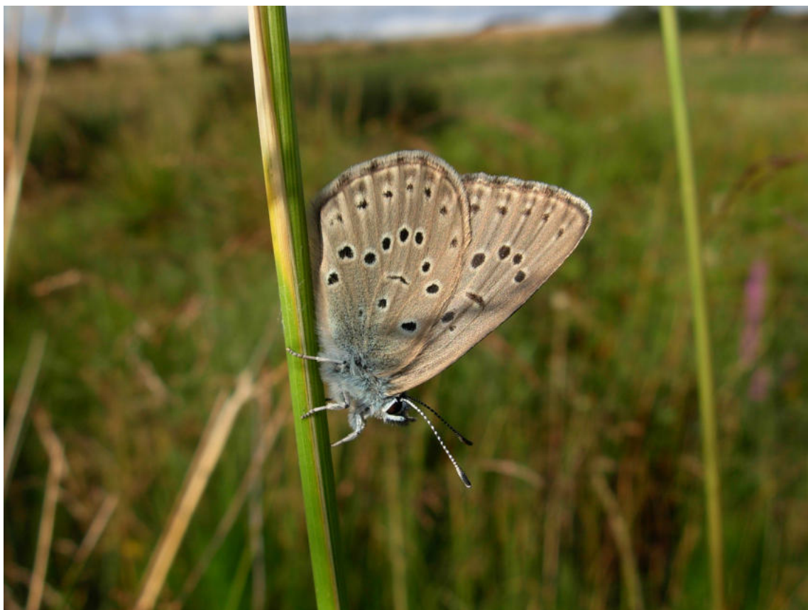
Fig. 4. — M. alcon , tourbière des Rauzes, Saint-Léons (Aveyron).