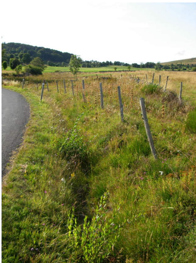
Fig. 3. — Bas-côté accueillant M. alcon , Prinsuéjols, Lozère.