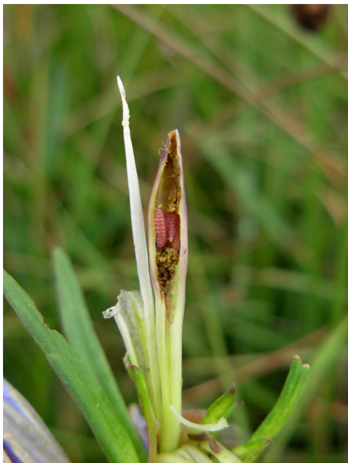
Fig. 2. — 3 chenilles de M. alcon peu avant leur sortie de la fleur de Gentiane pneumonanthe . Tourbière de Agladières, Saint-Léons, Aveyron.